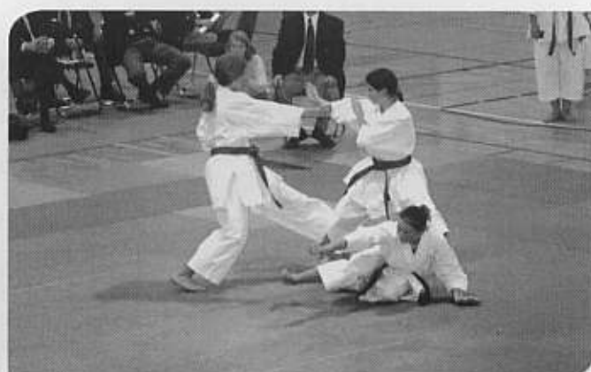
und mit Kata-Bunkai (die beiden Bilder gehören zusammen, da im Kata-Finale sowohl die Kata als auch Kata-Bunkai gezeigt wird)