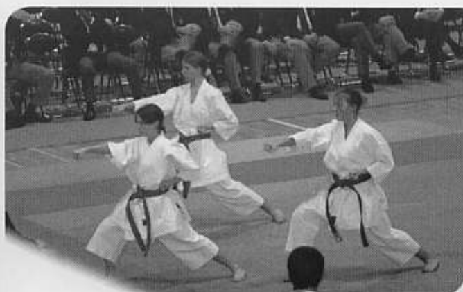
Das Kata-Team von SKR Germersheim im Kata-Finale