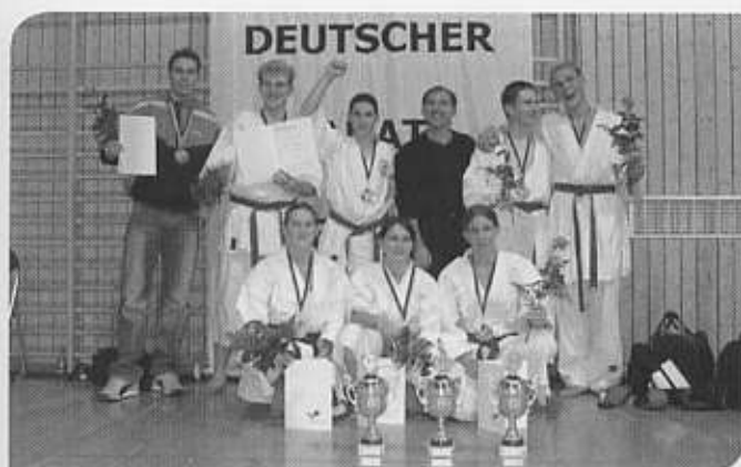
Die erfolgreichen Medaillengewinner des RKV